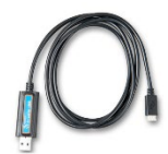
VE.Direct to USB interface