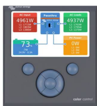
Color Control GX